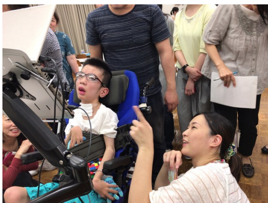
ICT 救助隊 with HPS Japan 病児障がい児コミュニケーション講座